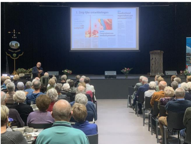
Jubileum symposiummiddag 27 november

Gedurende de scootmobiel tocht van 19 juni werden de deelnemers getraakteerd op koffie met vlaai bij Restaurant / Zorgboerderij Wouterberge in Someren-Eind. Op het einde van de tocht werd er een ijsje genuttigd bij Bacio.