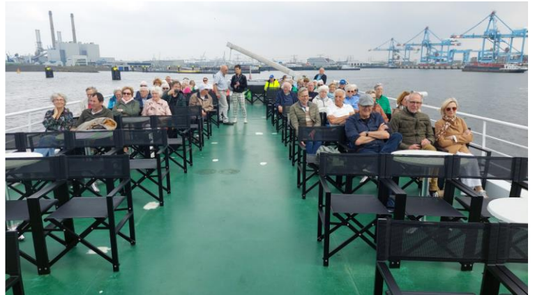
De voorjaarsreis van 4 juni