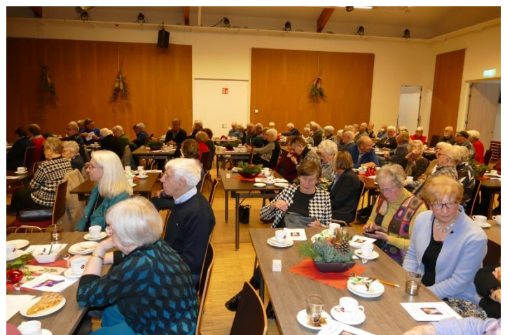
Jubileum viering 21 december in Hart van Heuze

Op 27 november was er 's middags een Symposium georganiseerd met een 2-tal sprekers :