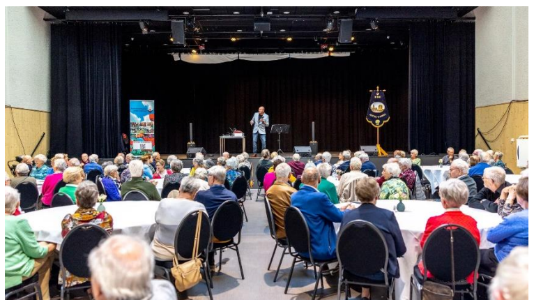
De lunch voor ouderen op 4 oktober