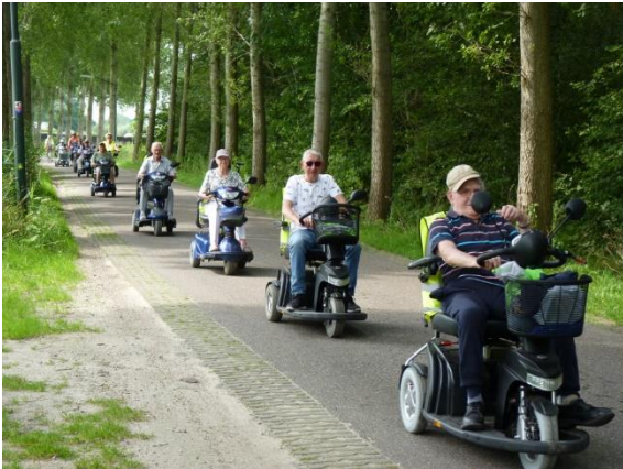
De speciale scootmobieltocht van 20 juli