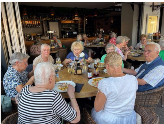
Uit Eten bij de Baron op 24 juli