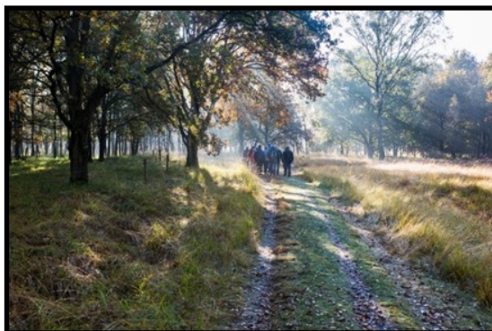
Senioren wandelen in de Mariapeel

Omdat we af en toe even ergens bij stil staan, en we in het veld een koffie- of theepauze houden (wel zelf meenemen!), duurt een activiteit 2,5 tot 3,5 uur.