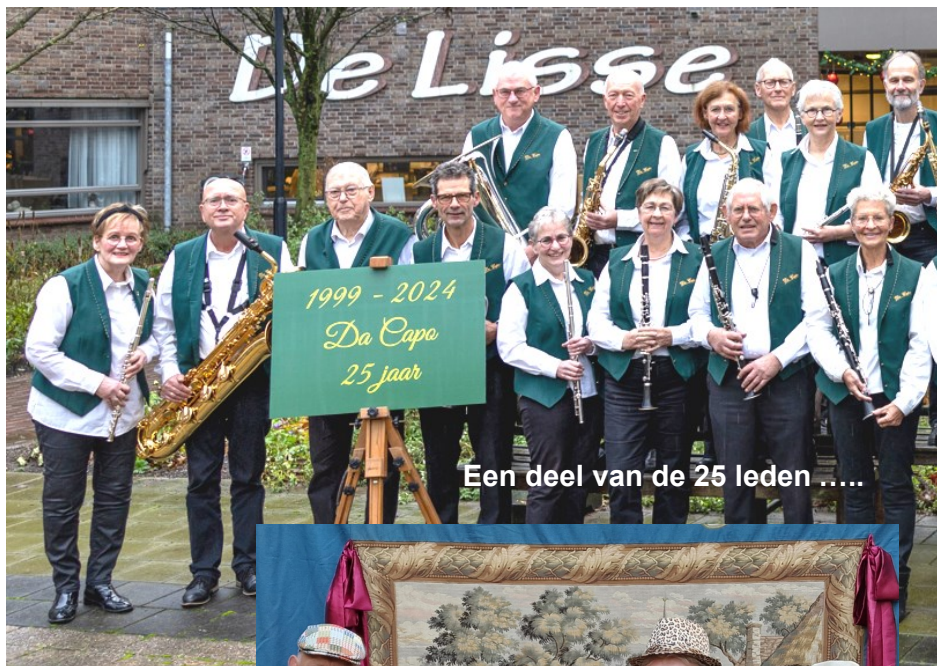
Een deel van de 25 leden .....