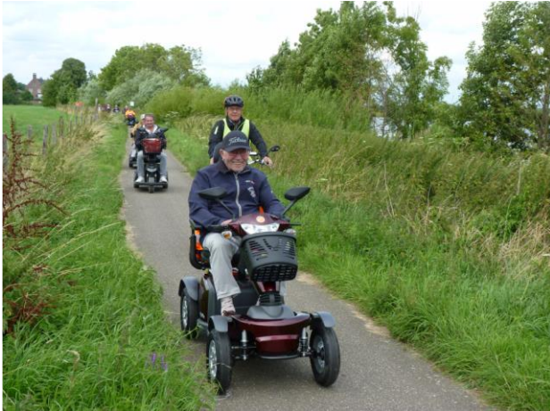
Scotmobiel verrassingstocht 22 juli