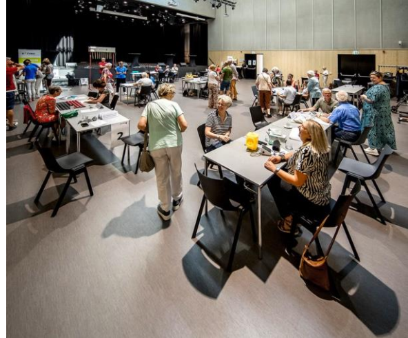
Vitaliteitsdag 21 juni