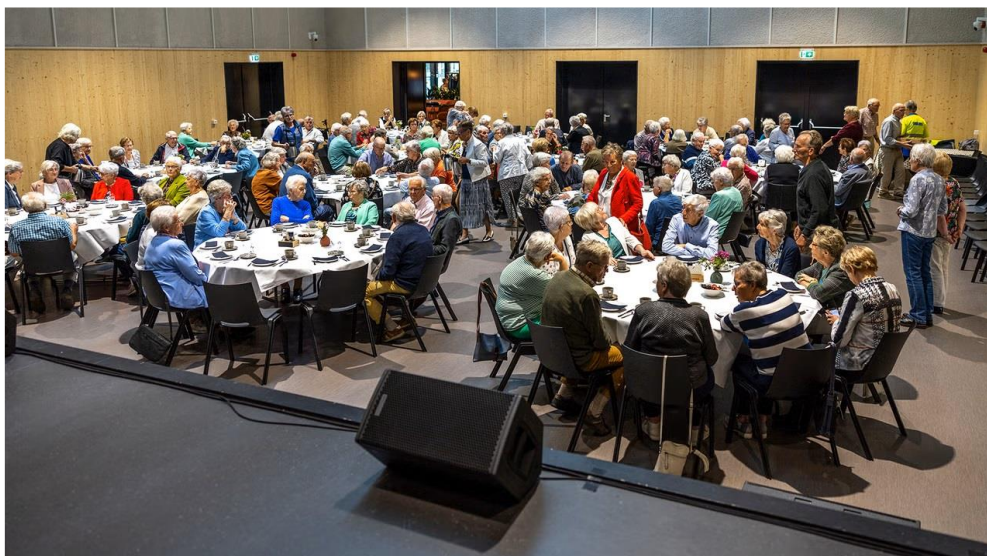
De ouderenlunch op 7 oktober