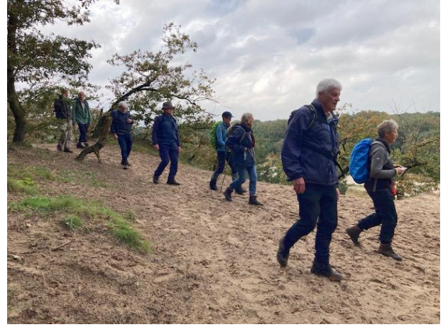
Stappers wandeltocht 26 oktober