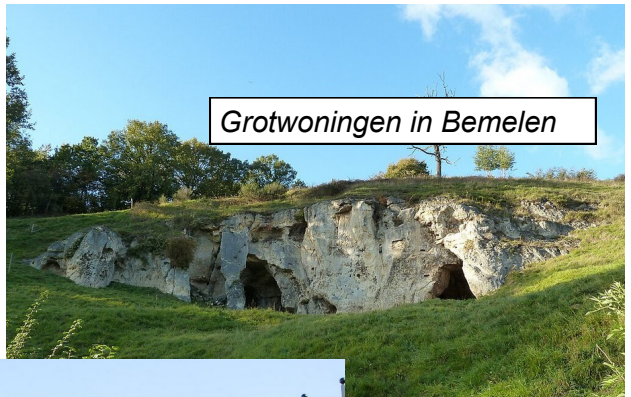
Grotwoningen in Bemelen