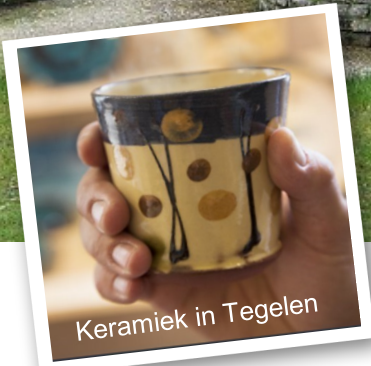
Keramik in Tegelen