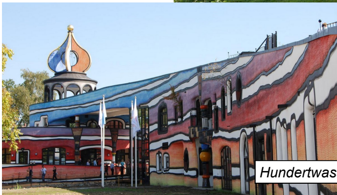
Hundertwasser in Houthem