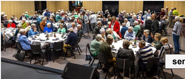
senioren ­ dag

Voor beëindigen lidmaatschap Seniorenvereniging bel vóór 1 januari 06-25 35 05 65 (ledenadministratie)